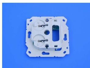
Module de base 125.0100